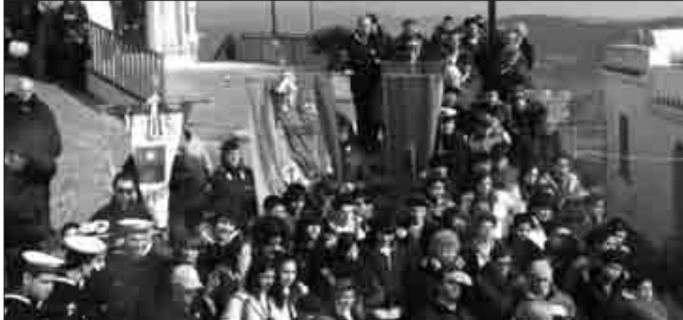
Un momento della gara

Adesso, dopo una settimana di tregua, ci sarà da preparare la finalissima, sperando che il pulmino messo in palio, prenda, finalmente, la strada per Melissa.